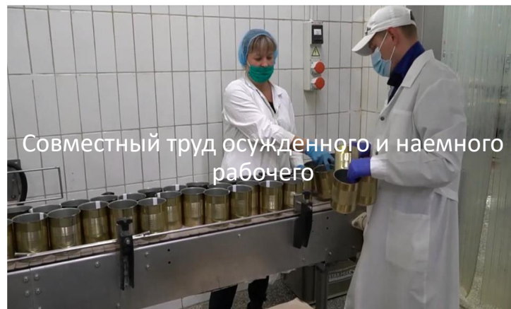
Совместный труд осужденного и наемного рабочего