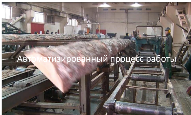
Автоматизированный процесс работы

Разделение осужденных от гражданских рабочих не предусмотрено.