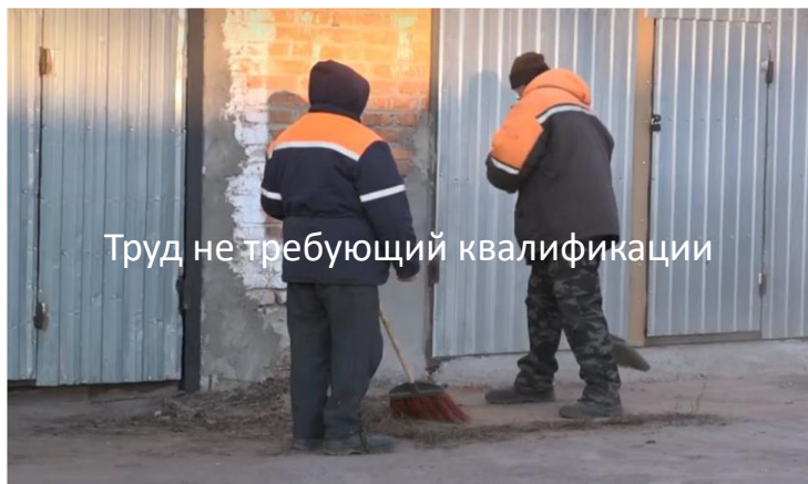
Труд не требующий квалификации